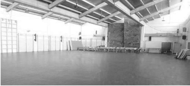
SALAS POLIVALENTES CAMPUS LA YUTERA