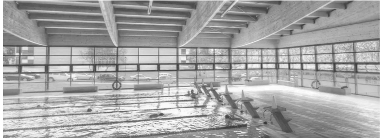
PISCINAS ERAS DE SANTA MARINA