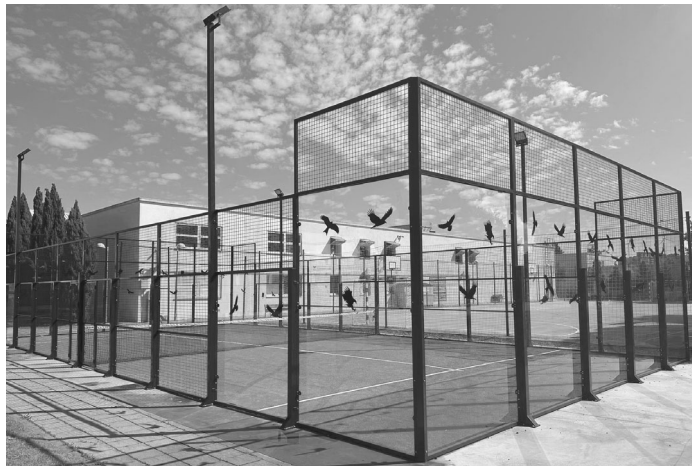
Pista de Pádel situada detras del edificio principal de la Yutera