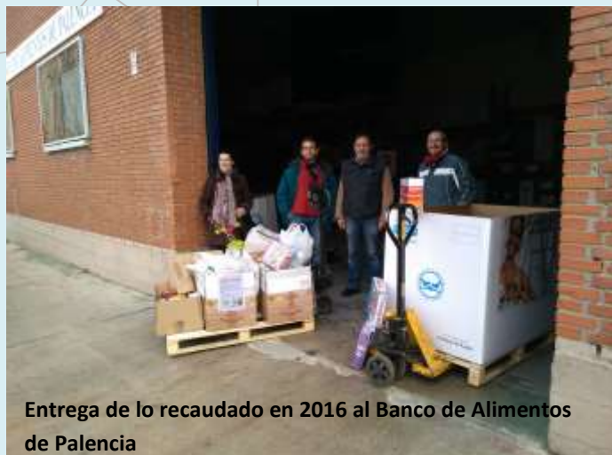
Entrega de lo recaudado en 2016 al Banco de Alimentos de Palencia