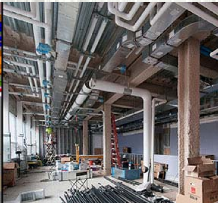
IMAGEN DE LO CONSTRUIDO